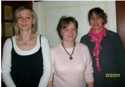
Vorstand des Fördervereins